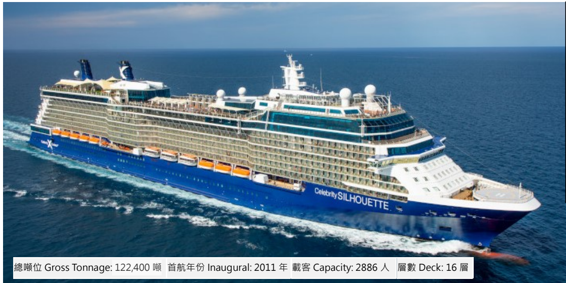
總噸位 Gross Tonnage: 122,400 噸 首航年份 Inaugural: 2011 年 載客 Capacity: 2886 人 層數 Deck: 16 層