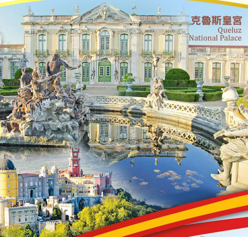
克魯斯皇宮 Queluz National Palace