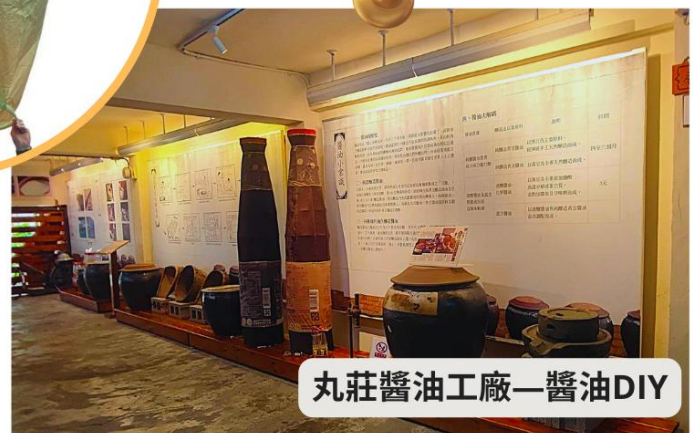
丸莊醬油工廠—醬油DIY